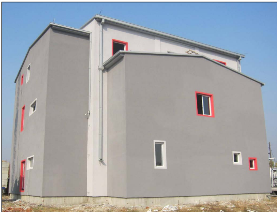
Изградба на Дом на Култура