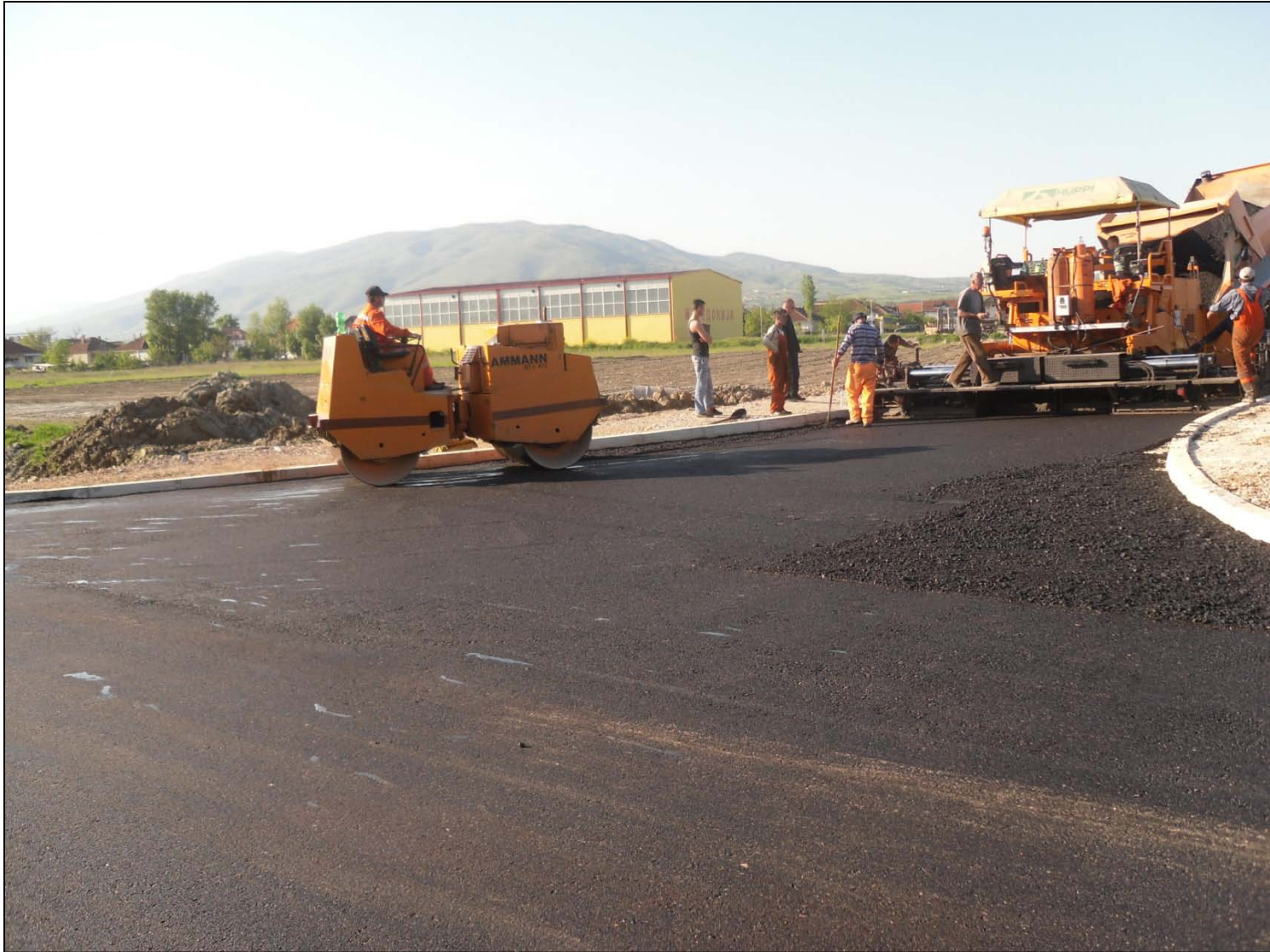
Асфалтирани локални улици