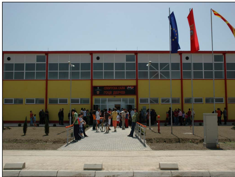
Изградена спортска сала Гоце Делчев